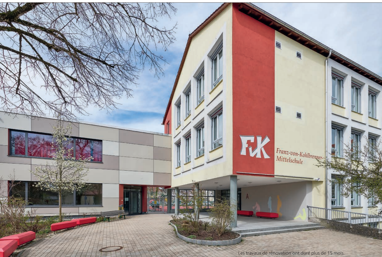
Les travaux de rénovation ont duré plus de 15 mois.