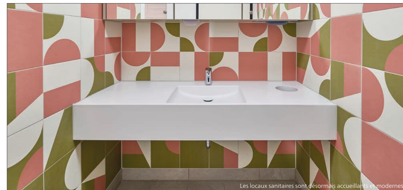
Les locaux sanitaires sont désormais accueillants et modernes.

Après l'achèvement des travaux qui ont duré plus de 15 mois, les nouveaux locaux ont été mis en service après les vacances de Noël 2023/24.