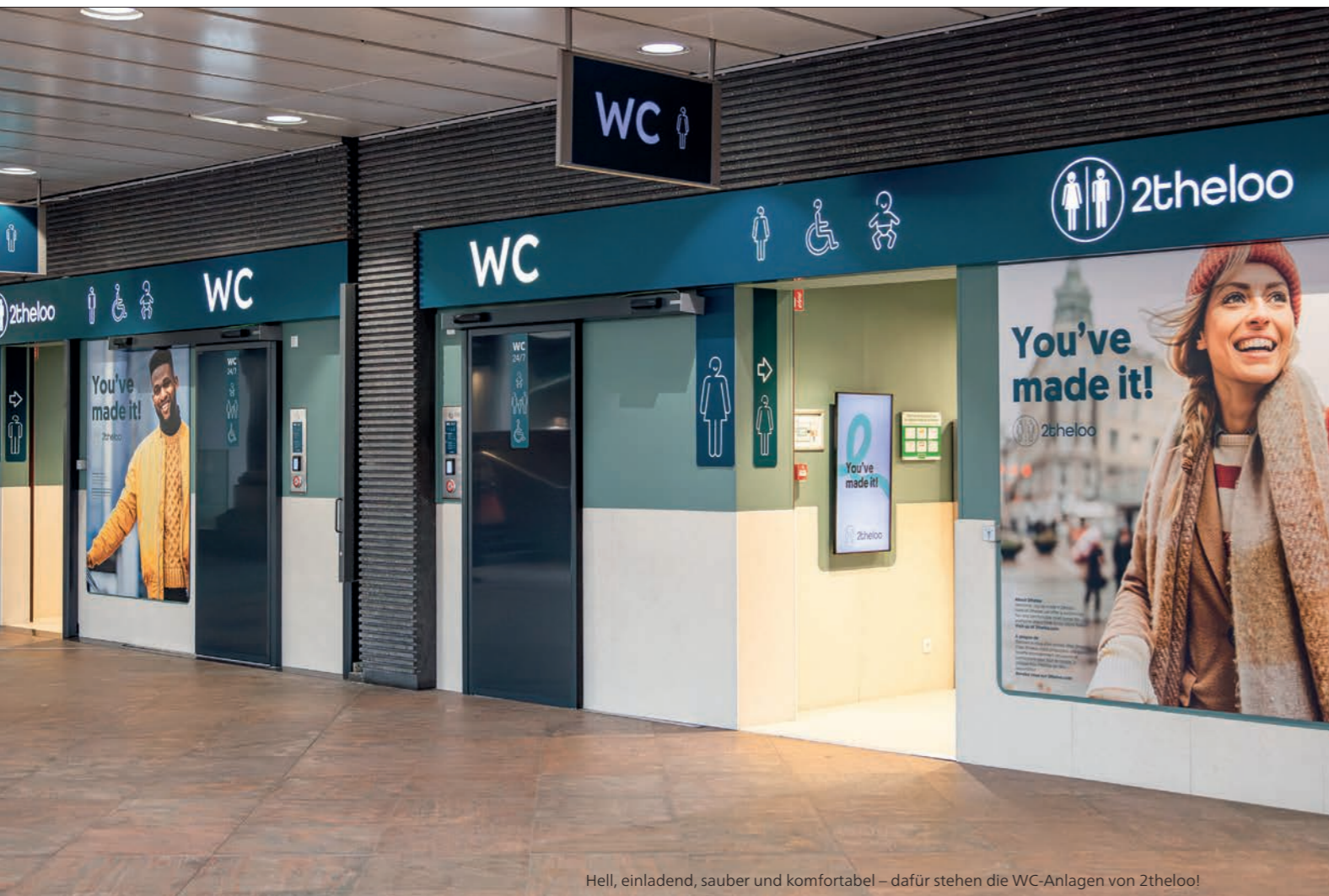
Hell, einladend, sauber und komfortabel – dafür stehen die WC-Anlagen von 2theloo!