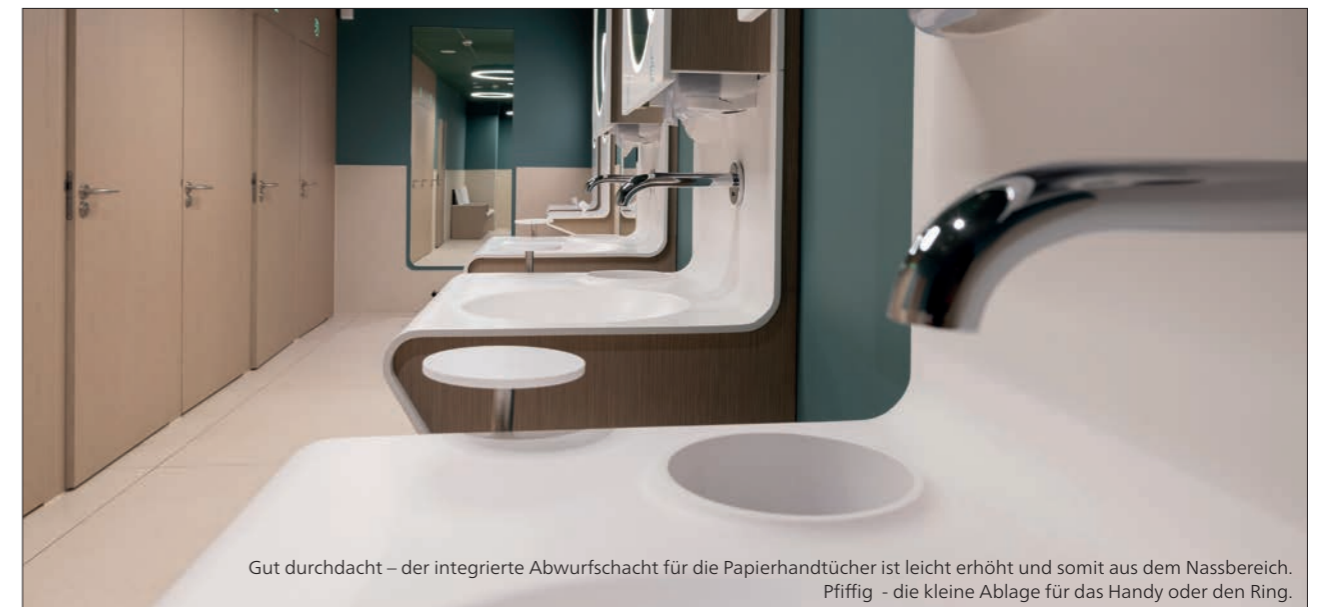
Gut durchdacht – der integrierte Abwurfschacht für die Papierhandtücher ist leicht erhöht und somit aus dem Nassbereich. Pfiffig - die kleine Ablage für das Handy oder den Ring.

Die Zusammenarbeit zwischen VARICOR® und 2theloo basierte von Anfang an auf Partnerschaft und einer sehr engen Zusammenarbeit schon während der Entwicklungsphase. Und das Ergebnis kann sich sehen lassen! Sanft geschwungene Waschplätze in elegantem Weiß mit integriertem Abwurfschacht für die Papierhandtücher und einem großzügigen eingelassenen Spiegel.