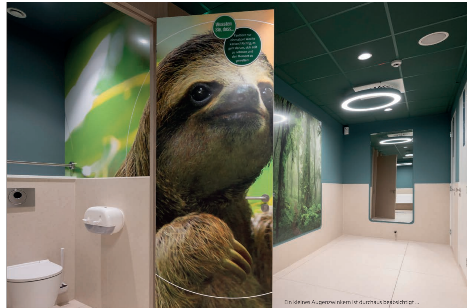
Ein kleines Augenzwinkern ist durchaus beabsichtigt ...

Die elegant geschwungenen Anlagen im Dekor True White sind nicht, wie man vermuten könnte, aus Plattenmaterial verklebt, sondern in zwei Teilen gegossen: einem Unterteil mit Becken, Papierabwurf und der sanft geneigten Schürze und einem Oberteil mit dem Ausschnitt für das Spiegelement.