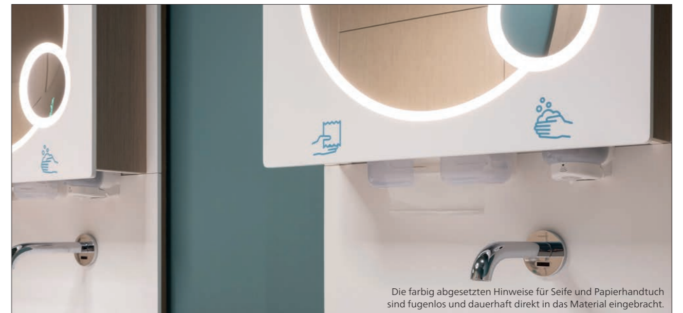
Die farbig abgesetzten Hinweise für Seife und Papierhandtuch sind fugenlos und dauerhaft direkt in das Material eingebracht.

Durch die Zusammenarbeit mit starken internationalen Partnern wie Shell, Total Energies oder den französischen (SNCF) und belgischen (NMBS) Eisenbahnen betreibt 2theloo mittlerweile über 175 öffentliche Toiletten in 8 Ländern – und ein Ende ist noch nicht in Sicht!