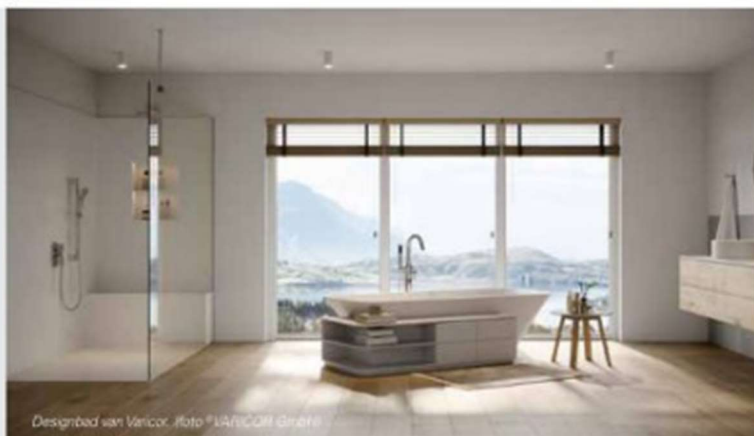
Designbad van Varicor.

Ook dit vrijstaande designbad, in één stuk vervaardigd uit Varicor solid surface, bleef niet onopgemerkt en mag pronken met een German Design Award 2024. Verkrijgbaar in ongeveer vijftig standaardkleuren en optioneel verder te personaliseren met het ColorLine-systeem. Hierbij wordt een decor naadloos en permanent in het materiaal aangebracht. Eveneens in optie: precies passende aanbouwoplossingen die op elegante wijze extra opbergruimte creëren en het design vervolledigen. Varicor wordt in België exclusief verdeeld door Engels Surfaces.