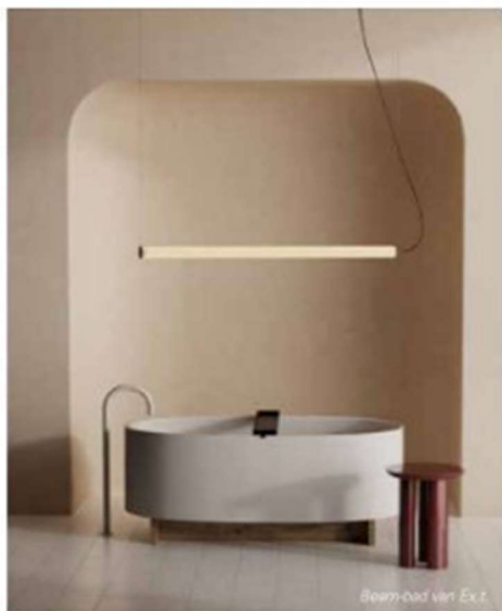
Beam-bad van Ex.t