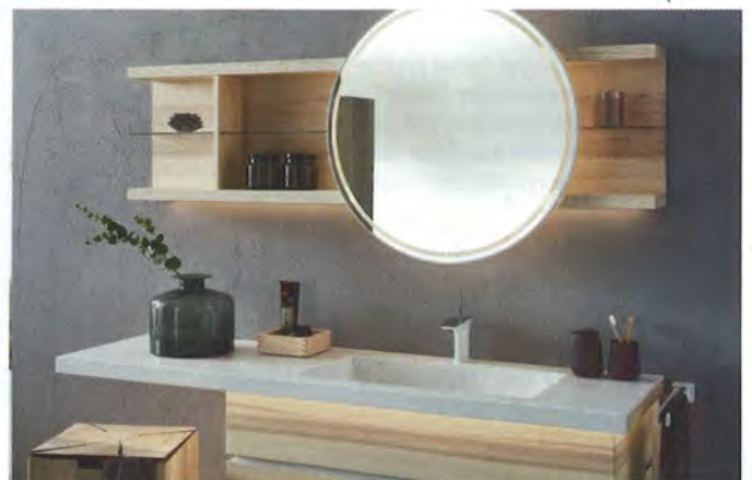
Neue Kollektion fürs Bad von Varicor und Thielemeyer