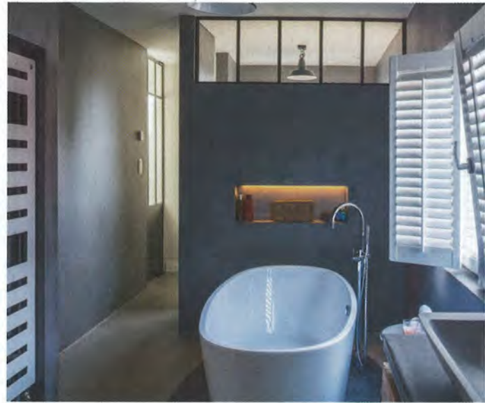
Aus Kunststoff oder Holz: Sichtschutz fürs Bad